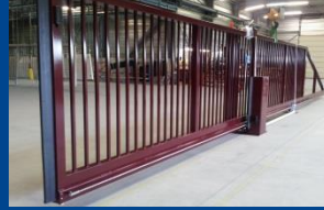
Portail assemblé et testé