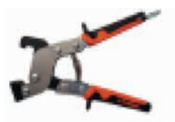
Pince clips haute qualité