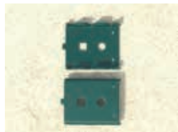
Clips de fixation acier et plastique