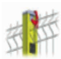
Crochet support pour panneau