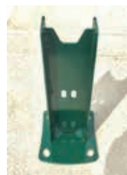
Platine à emboîter