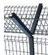
Bavolet double (à visser) Panneau à 90°