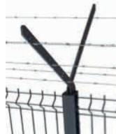
Bavolet double (à visser) Fil de ronce