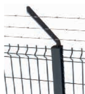
Bavolet simple (à visser) Fil de ronce