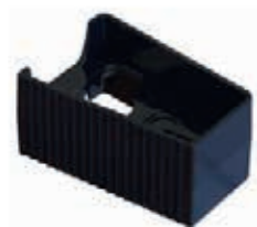
Cale de montage (tension grille)