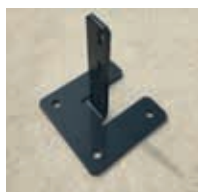
Platine à emboîter et Boulonner (3 M8)